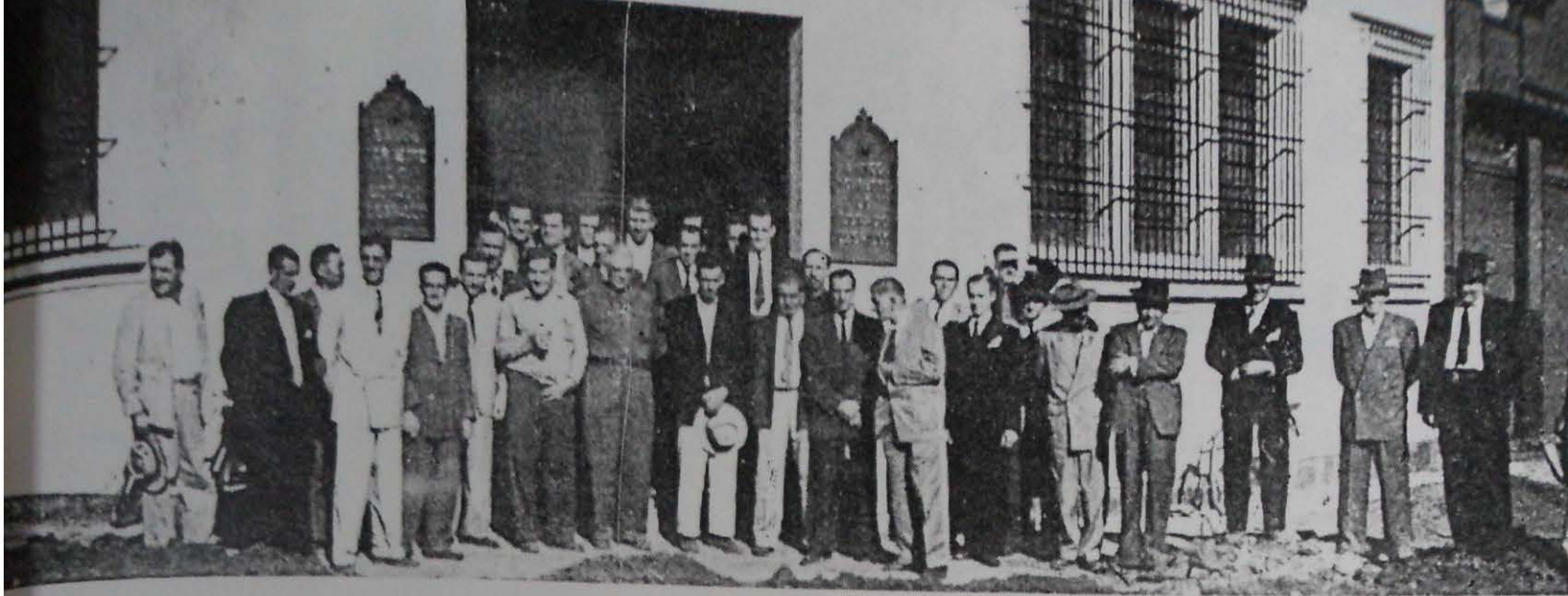
Em frente à nova agência, reuniu-se um grupo de convidados em póse especial para a reportagem.